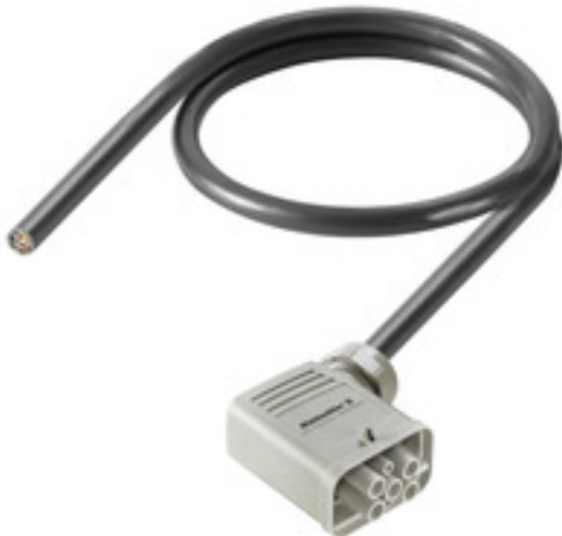
Product similar to illustration