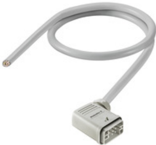
Product similar to illustration