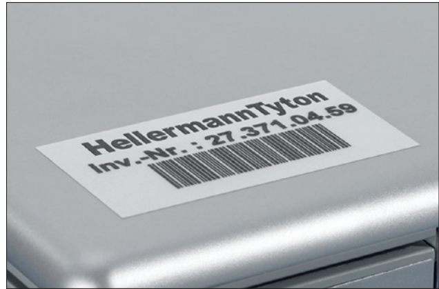
Klare und prägnante Inventarkennzeichnung einfach realisiert.