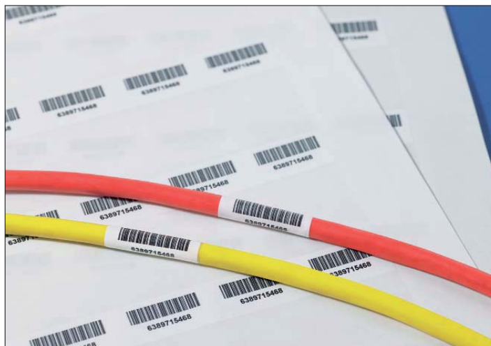
Helatag sorgt für die dauerhafte Kennzeichnung von Kabeln mit Barcodes.

Alle HellermannTyton-Etiketten für den Laserdrucker werden in einer praktischen Kunststoffbox geliefert, die die Etiketten bis zu ihrer Verwendung vor äußeren Einflüssen schützt und damit die Haltbarkeit des Etikettenmaterials erhöht.