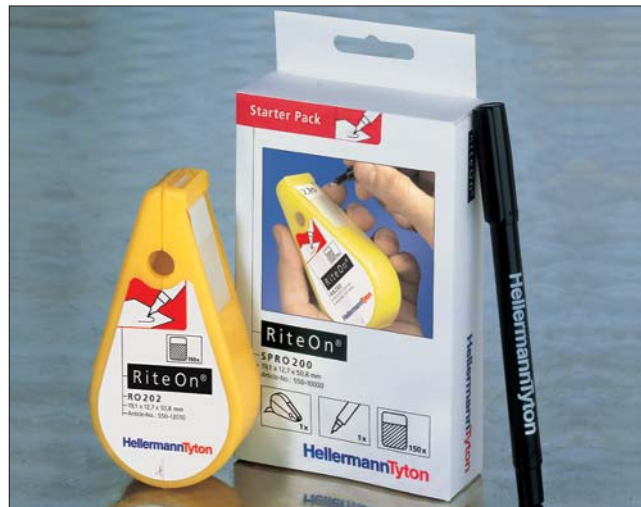
Schnelle und einfache Kennzeichnung mit RiteOn.

Die Etiketten werden in 3 Abmessungen für Kabeldurchmesser von 4 bis 18 mm angeboten.