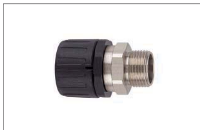
HelaGuard HG-SM, gerade Verschraubung mit drehendem Messing-Außengewinde.