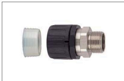
HelaGuard HGL-SM, gerade Verschraubung mit drehendem Außengewinde inkl. Schlauchdichtung.