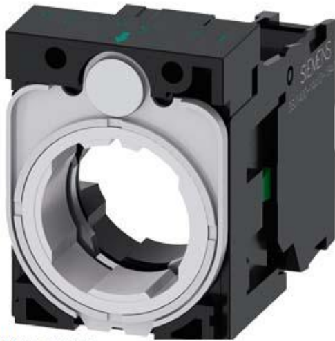
HALTER FUER 3 MODULE, KUNSTSTOFF, 1S, SCHRAUBANSCHLUSS